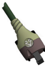
RJ 45 gerader, umspritzter Stecker mit Schraubverriegelung/vertikal

Das Kabel widersteht mehr als 12 Millionen Zyklen des standardisierten Northwire Kabelbiegungstestprotokolls (N.S.F.T.P.) Modus A 1 .