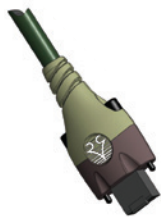
RJ 45 gerader, umspritzter Stecker mit Schraubverriegelung/horizontal