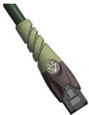
RJ 45 gerader, umspritzter Stecker